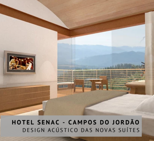
HOTEL SENAC - CAMPOS DO JORDÃO DESIGN ACÚSTICO DAS NOVAS SUÍTES