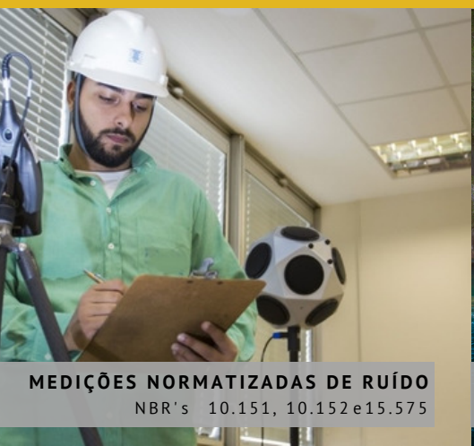
MEDIÇÕES NORMALIZADAS DE RUÍDO NBR's 10.151, 10.152 e 15.575