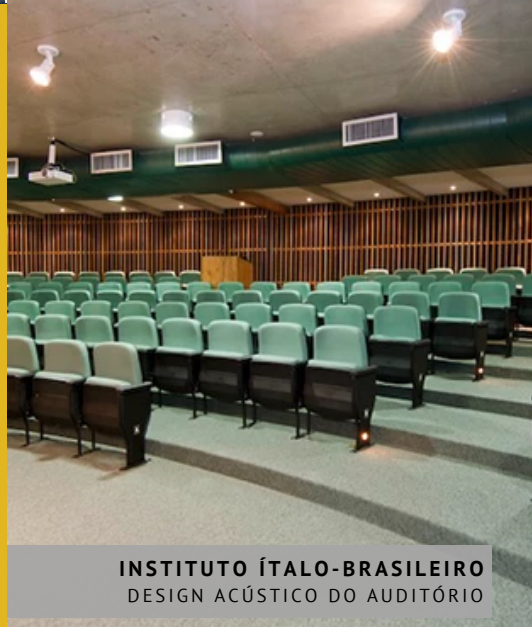
INSTITUTO ÍTALO-BRASILEIRO DESIGN ACÚSTICO DO AUDITÓRIO