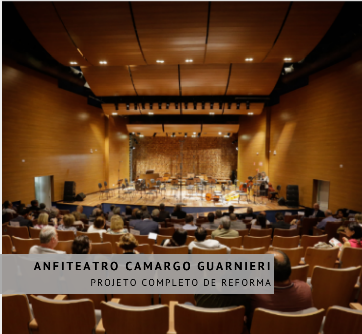
ANFITEATRO CAMARGO GUARNIERI PROJETO COMPLETO DE REFORMA

PASSERI Acústica é uma empresa independente de prestação de serviços de projeto e consultoria especializada em acústica das edificações, acústica urbana e acústica de salas desde 1999. Nossa sede é em São Paulo, SP, mas estamos preparados e equipados para atender clientes em todo o Brasil e na América Latina!