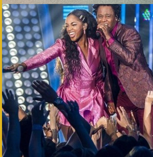
ESTÚDIOS GLOBOSAT RJ PROJETO DE ACÚSTICA DOS ESTÚDIOS