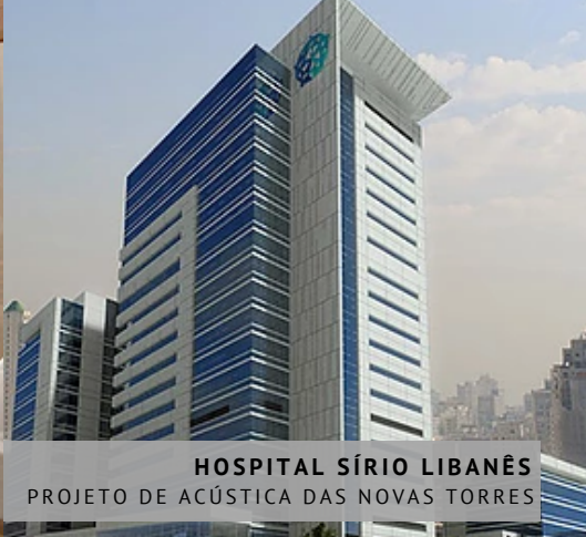
HOSPITAL SÍRIO LIBANÊS PROJETO DE ACÚSTICA DAS NOVAS TORRES