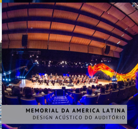
MEMORIAL DA AMERICA LATINA DESIGN ACÚSTICO DO AUDITÓRIO