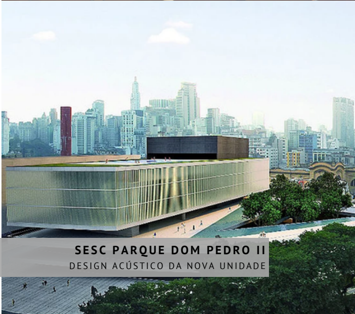
SESC PARQUE DOM PEDRO II DESIGN ACÚSTICO DA NOVA UNIDADE

PASSERI Acústica é uma empresa independente de prestação de serviços de projeto e consultoria especializada em acústica das edificações, acústica urbana e acústica de salas desde 1999. Nossa sede é em São Paulo, SP, mas estamos preparados e equipados para atender clientes em todo o Brasil e na América Latina!