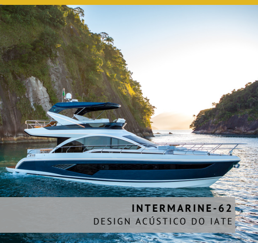
INTERMARINE-62 DESIGN ACÚSTICO DO IATE