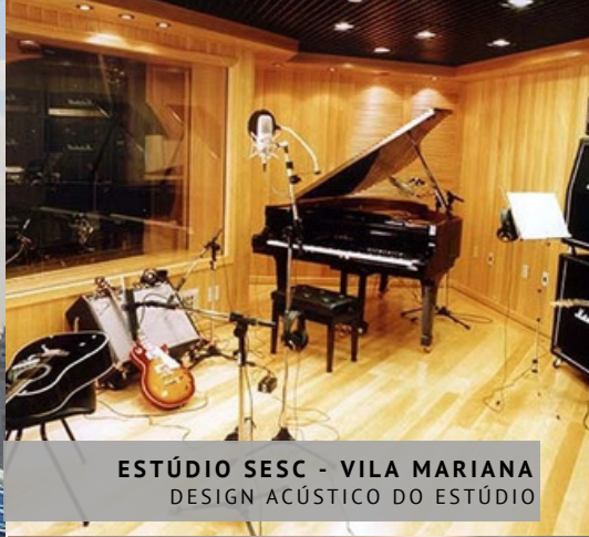
ESTÚDIO SESC - VILA MARIANA DESIGN ACÚSTICO DO ESTÚDIO